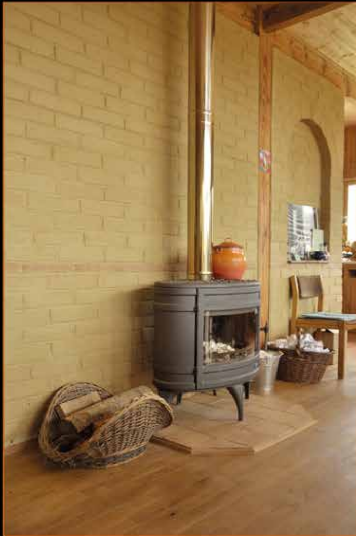
Mur en briques de terre crue comme élément d'inertie derrière le poêle à bois