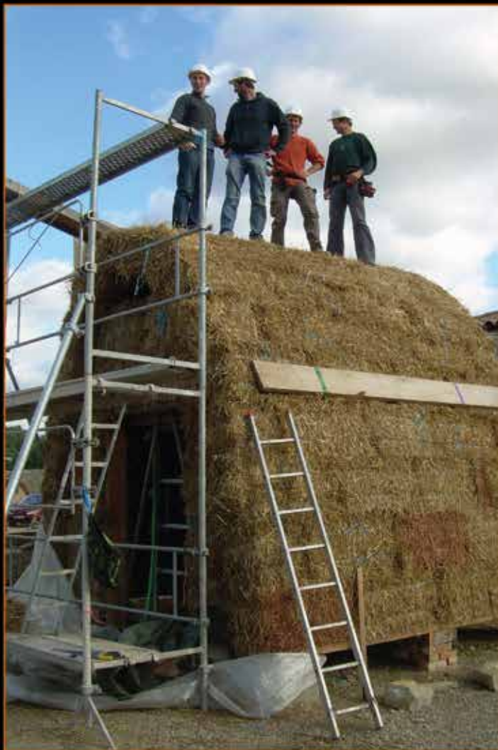
Voûte en paille porteuse