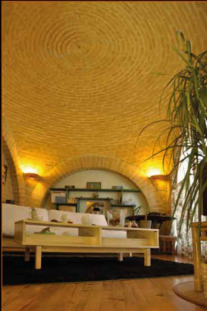
Voûte nubienne en briques de terre crue dans le Lauragais