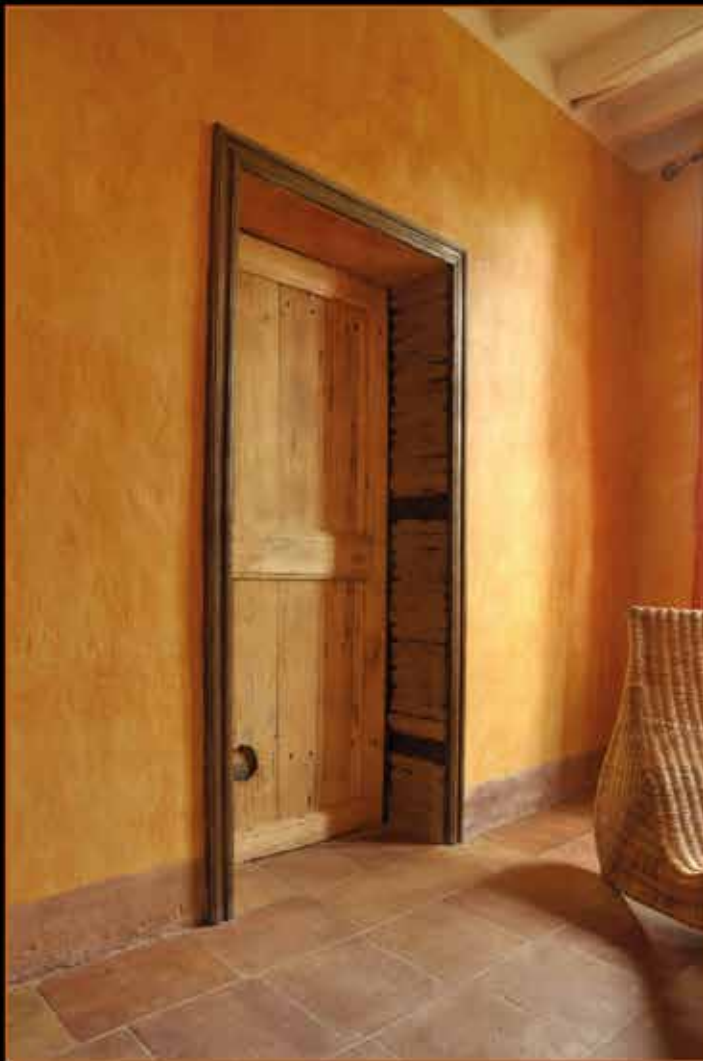
Porte ancienne avec badigeon à la chaux