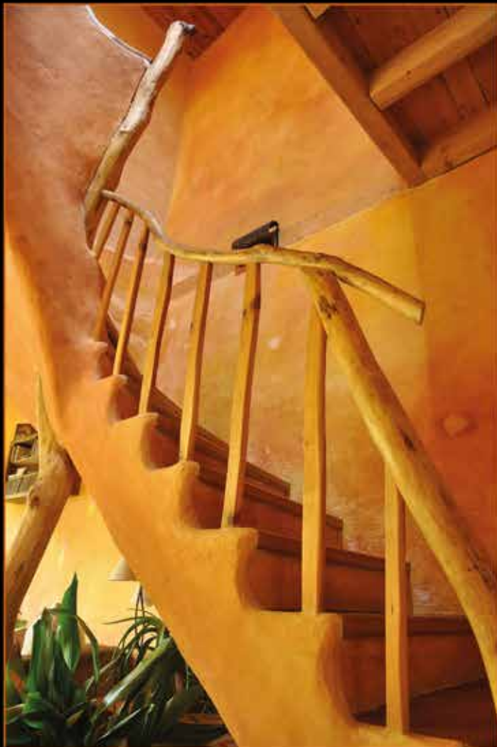
Escalier aux lignes organiques en béton banché badigeonné à la chaux