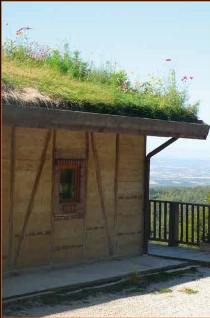
Toiture prairie dans le Minervois