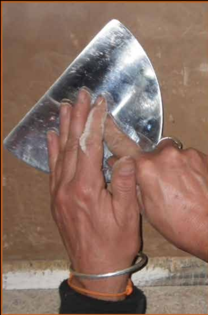
Michèle Bailly réalisant un enduit chaux