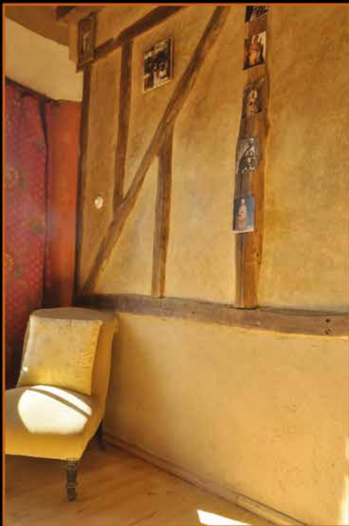
Enduit de terre crue et colombages