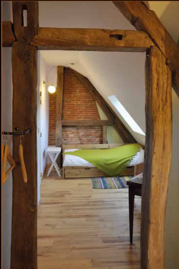
Comblis isolées en fibre de bois